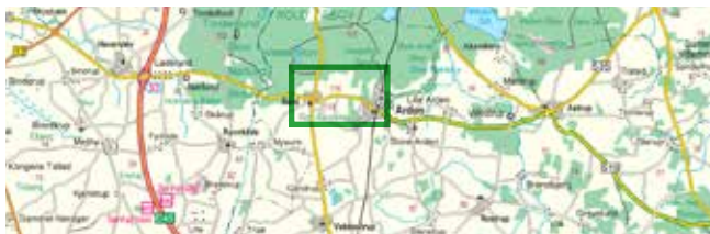
© Kort & Matrikstyrelsen (G. 21-01)

Rold ligger, hvor vej 180 og 535 krydser hinanden. Sporet starter ved Cirkusmuseet, hvor der er parkering. Bus 118 mellem Terndrup og Hobro kører på hverdage og stopper i Rold. Den grønne firkant viser udsnit svarende til rutekortet på indersiderne. GPS-koordinater til startpunktet: 56.773012, 9.816407.