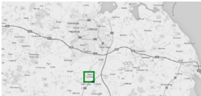
© Kort & Matrikstyrelsen (G. 21-01)

Sporene ved Nr. Lyndelse ligger ca. 12 km. syd for Odense med start fra Nr. Lyndelse kirke. Den grønne firkant viser udsnit svarende til rutekortet på indersiderne. Startsted ved Nr. Lyndelse Kirke, Albanivej 15A, 5792 Årslev. GPS-koordinater: 55.303763, 10.396427.