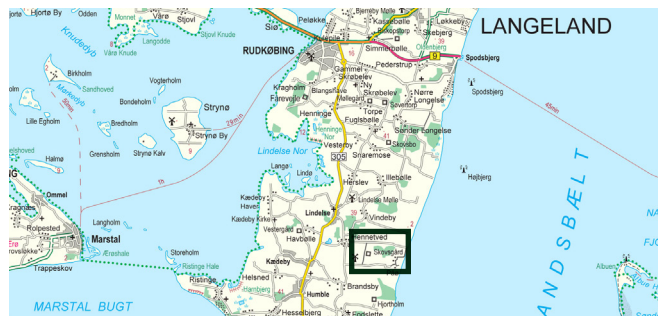
© Kort & Målestyrelsen (G. 21-01)

Stien over Påo Enge er et af de 5 spor, der fører gennem herregårdslandskabet på Danmarks Naturfond's økologiske herregård Skovsgaard på Langeland. Skovsgaard ligger ca. 13 km syd for Rudkøbing. Fra Lindelse køres mod øst til Hennemved, hvorfra der er skiltning til Skovsgaard. Stien udgår fra P-pladsen ved stranden for enden af Kågårdsvej ca. 2,5 km øst for Skovsgaard. Den grønne firkant svarer til rutekortet på undersiden.