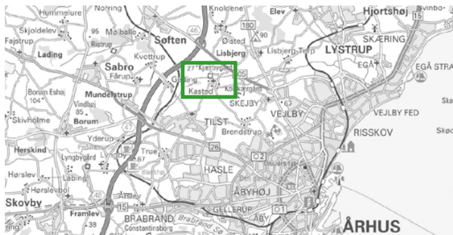
© Kort & Matrikstyrelsen (G. 21-01)

Sporene ved Kasted ligger ca. 9 km. nordvest for Århus ved landsbyen Kasted. Den grønne firkant viser udsnit svarende til rutekortet på indersiderne.